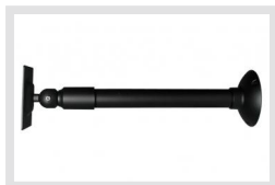
VM-LCD/WCMB-1 | Artikelnummer: 90394