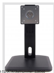
VM-TSHX | Artikelnummer: 228560