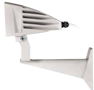
GEKO IRN 24VAC/12-24VDC