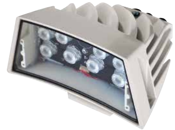
GEKO IRN 24VAC/12-24VDC WEISSES LICHT

Die vom Scheinwerfer GEKO erzeugte Beleuchtung erhellt gleichmäßig das gesamte Sichtfeld und beseitigt Lichtflecken und Unterbelichtungen für unübertreffliche Nachtbilder und eine sichere Überwachung des Bereichs. Der Hochleistungskühlkörper garantiert die maximale Lebensdauer der LEDs und Schutz gegen Übertemperaturen, während das Frontglas aus Spezialkunststoff eine hohe infrarote Durchlässigkeit bietet. Die Scheinwerfer sind zudem gegen elektrostatische Entladungen geschützt. GEKO ist in den Versionen 24Vac/12-24Vdc oder 100-240Vac mit integriertem Netzteil verfügbar. GEKO wird mit der Halterung für die Wandmontage geliefert, die sich waagrecht und senkrecht drehen lässt. Die Gewährleistung von GEKO Infrarotscheinwerfer ist 5 Jahre, während für GEKO mit dem weißen Licht ist 2 Jahre.