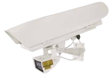
HOV + OSUPPIR + GEKO IRH + WBJA