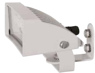
GEKO IRH WEISSES LICHT