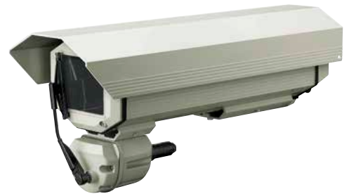
HEG + VIP6A