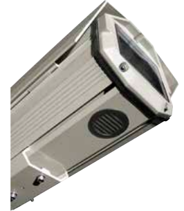
HEG: AUSFÜHRUNG MIT KÜHLSYSTEM